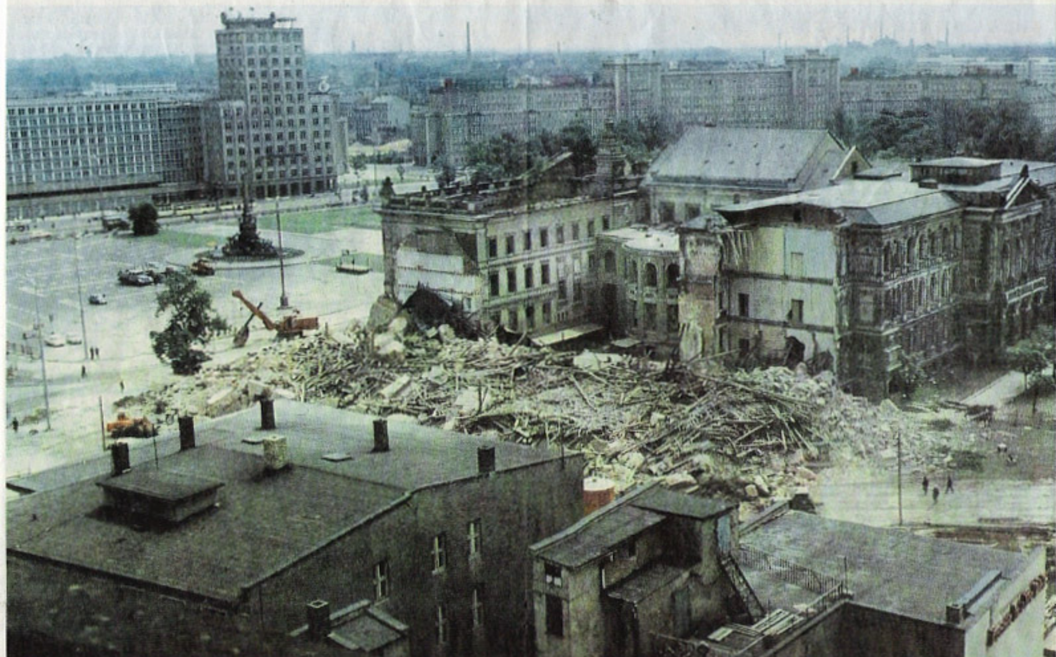
Die Kirche ist nur noch ein Schutthaufen. Der Leipziger Bernhard Richter schoss das Foto nach der Sprengung vom Turm von St. Nikolai.